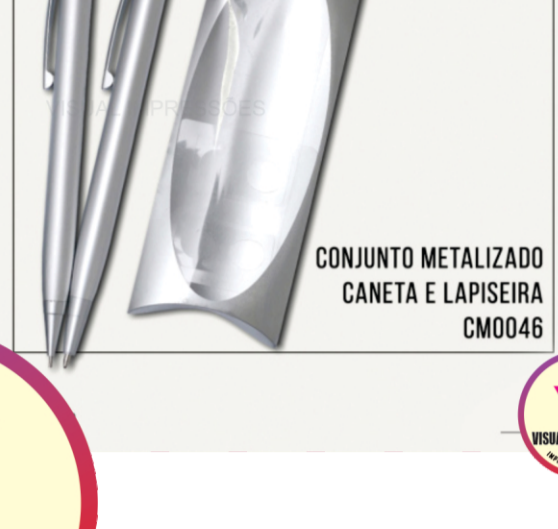
CONJUNTO METALIZADO CANETA E LAPISEIRA CM0046