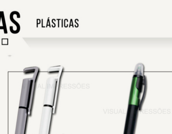
CANETA SUPORTE PARA CELULAR E TOUCH