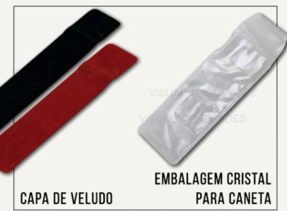
CAPA DE VELUDO