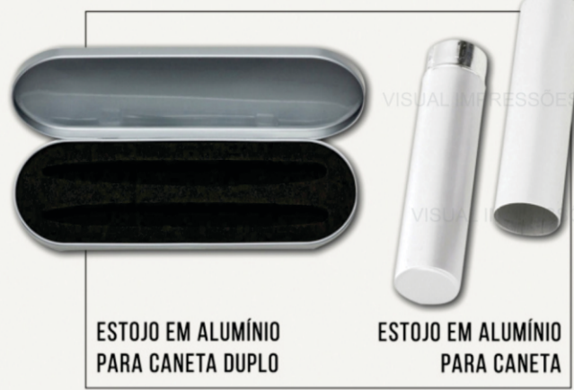
ESTOJO EM ALUMÍNIO PARA CANETA DUPLA